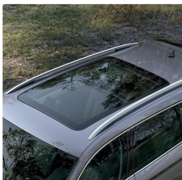
Bolsillos en el respaldo de asientos delanteros