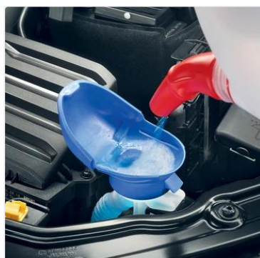
Embudo integrado para líquido limpiaparabrisas