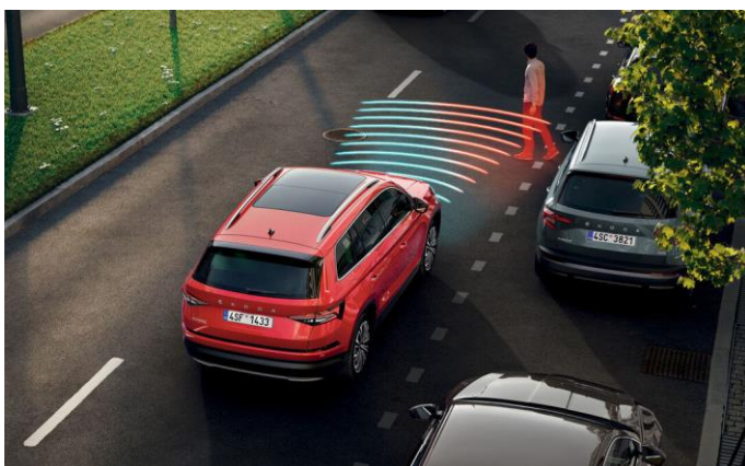
Sistema de frenado automático: Front Asisst