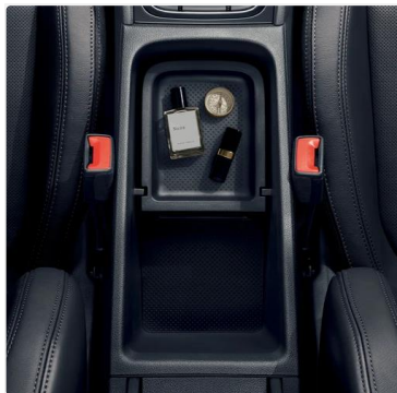
"Jumbo Box" en el reposabrazos central