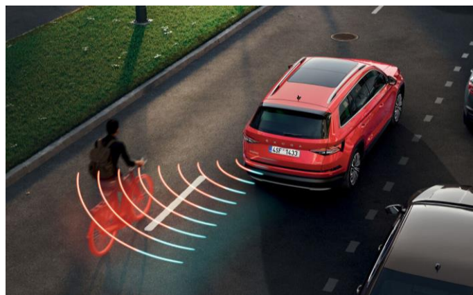
Side Assist: asistente de cambio de carril