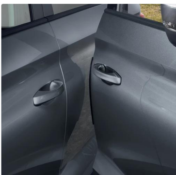
Ganchos para bolsos en el maletero