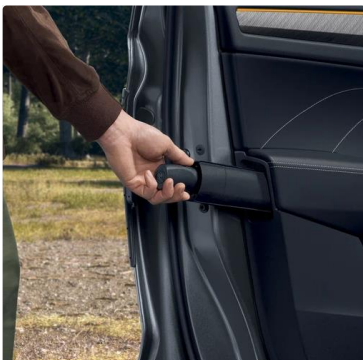
Paraguas en la puerta del conductor