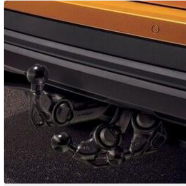
"Jumbo Box" en el reposabrazos central