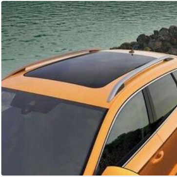
Ganchos para bolsos en el maletero