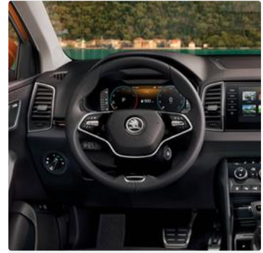
Porta botellas en todas las puertas