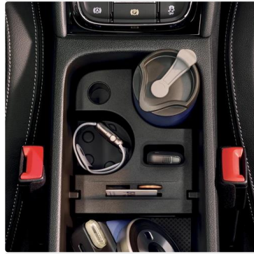
Bolsillos en el respaldo de asientos delanteros