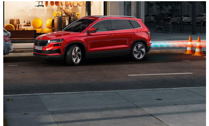
Cámara y sensores de estacionamiento delanteros y traseros