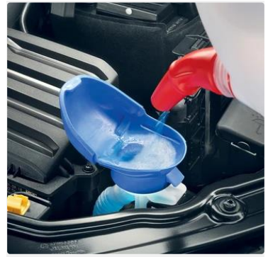
Embudo integrado para líquido limpiaparabrisas