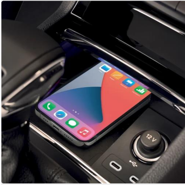
Paraguas en la puerta del conductor